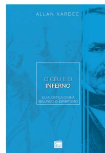
O CÉU E O INFERNO