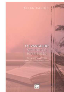
O EVANGELHO SEGUNDO O ESPIRITISMO