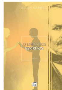
O LIVRO DOS ESPÍRITOS