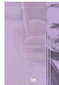
O LIVRO DOS MÉDIUNS