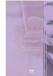
O LIVRO DOS MÉDIUNS