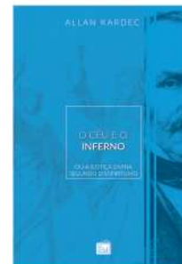
O CÉU E O INFERNO