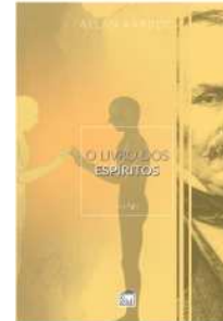
O LIVRO DOS ESPÍRITOS