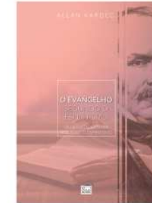
O EVANGELHO SEGUNDO O ESPIRITISMO